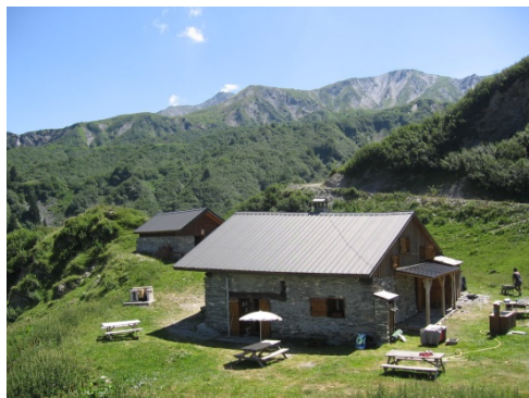
L Le refuge

Au-dessus du barrage de Saint-Guérin, au cœur du massif du Beaufortain, sur la commune de Granier-sur-Aime, vous découvrirez LE REFUGE DE L'ECONDU.