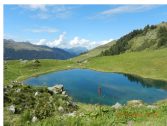
Le lac des Fées

Un paysage grandiose aux teintes multicolores où la flore abondante parfume l'air de multiples senteurs. Un lieu reposant où l'on apprend à « écouter le silence » qui s'harmonise parfois avec le sifflement des marmottes et le cri de l'aigle royal.