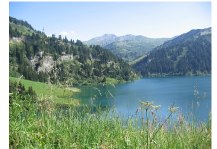
Lac de St-Guérin , au fond, le Crêt du Rey